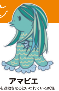
アマビエ 疫病を退散させるといわれている妖怪

未来は子どもたちのもの! ペットボトルは全く使っていません。 マイボトルを持参しています。